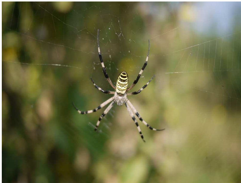
Figure 2 : une araignée.

Ancrer les images au caractère et les centrer (en centrant le caractère).