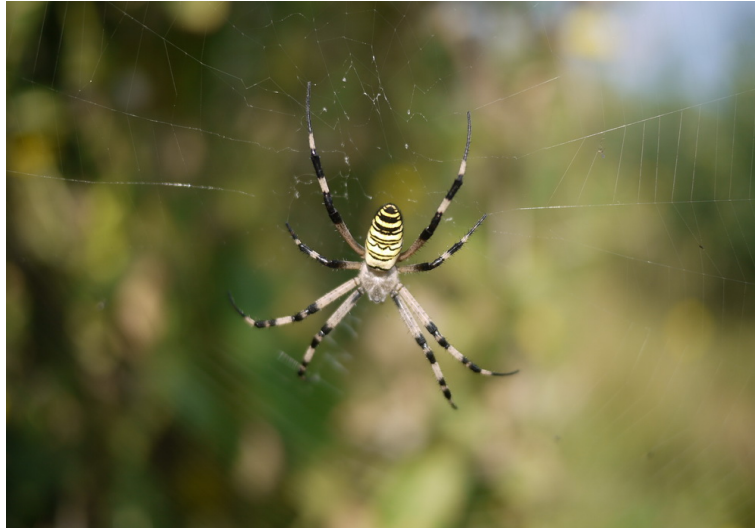
FIGURE 2 – une araignée.